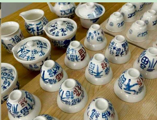
图 6 烧制成瓷

通过将专业教学与社会实践、文化传承、校庆献礼有机结合，不仅有效拓宽了学生的专业视野，显著提升了其实践创新能力，更让设计教育真正服务于地方文化建设和母校发展大局。