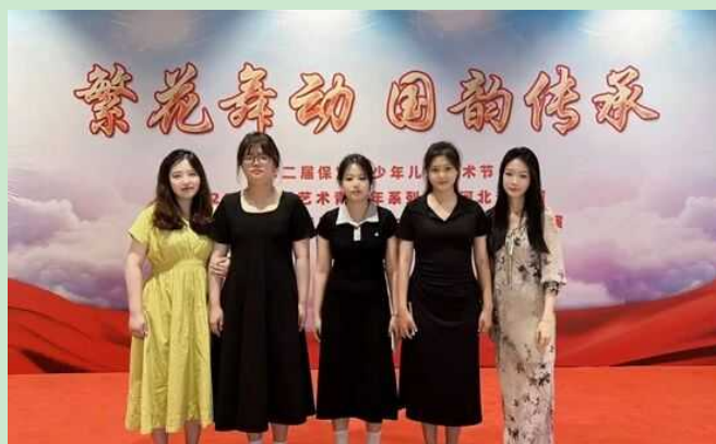
图二 参赛学生与指导教师合影

荣誉的背后，是学子们日复一日地潜心打磨，更是师生携手共进的不懈付出。自接到参赛通知以来，指导老师与参赛学子迅速组建攻坚小组，从作品主题构思、内容设计到细节打磨、现场展示，每一个环节都精益求精。