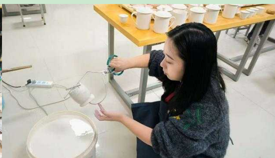
图 4 施釉

10月20日为庆祝母校20周年华诞，产品设计专业为前来祝贺的嘉宾和领导精心准备陶瓷礼品。师生们怀着对保定理工学院的深厚情感与美好祝愿，以“陶土为纸，匠心为笔”，将专业智慧与赤子之心熔铸于泥土与火焰之中。经过数日的精心构思与潜心创作，一批造型典雅、意蕴深远的陶瓷礼品惊艳亮相。这些作品或温润如玉，或质朴沉稳，每一件都凝聚着师生们的心血与汗水，每一件都烙印着保定理工学院的专属印记，共同创造了属于保定理工学院的“器物新象”。