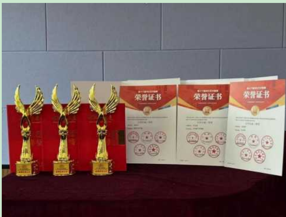
图 1 荣誉证书

金秋送爽，捷报频传！近日，备受关注的“河北省艺术联展”获奖名单正式揭晓，由我院学前教育专业张子琪、张珂瑶老师带领学前 2403 班张宝迪、学前（专）2402 班关梦雪、学前 2403 班梁彤宇在众多参赛者中脱颖而出，凭借扎实的专业功底、出色的现场表现，一举斩获省级二等奖 2 项、省级三等奖 1 项，为学校 and 学院赢得了荣誉！