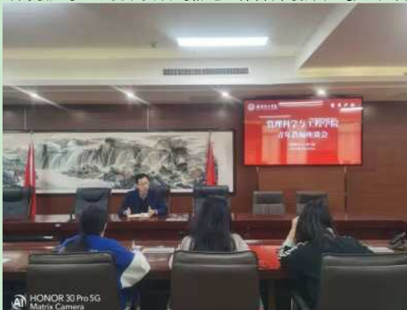
图 2 教师座谈会

将认真梳理汇总，积极向学校反映并争取资源。对于属于学院职责范围内的具体问题，学院将明确责任、分类推进，尽快落实改进措施，努力为教师营造更好的育人环境。