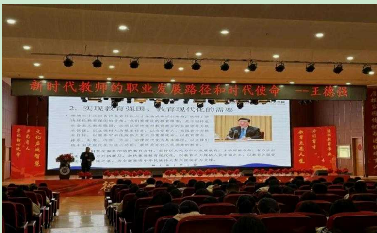
图1 王德强老师作讲座

10月19日，教育学院特邀河北师范大学家政学院院长、硕士研究生导师、中国教育学会家庭教育专业委员会常务理事王德强博士，为学院大一新生带来了一场题为“新时代教师的职业发展路径和时代使命”的专题讲座。本次讲座旨在引导师范生深刻理解时代重任，科学规划职业未来，为成为一名优秀的人民教师奠定坚实基础。