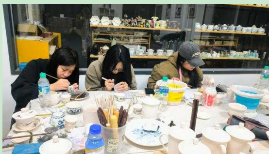
图 3 釉下彩绘