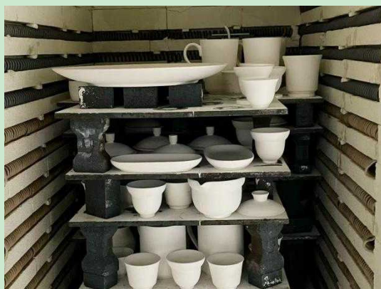
图 5 装窑

10月20日为庆祝母校20周年华诞，产品设计专业为前来祝贺的嘉宾和领导精心准备陶瓷礼品。师生们怀着对保定理工学院的深厚情感与美好祝愿，以“陶土为纸，匠心为笔”，将专业智慧与赤子之心熔铸于泥土与火焰之中。经过数日的精心构思与潜心创作，一批造型典雅、意蕴深远的陶瓷礼品惊艳亮相。这些作品或温润如玉，或质朴沉稳，每一件都凝聚着师生们的心血与汗水，每一件都烙印着保定理工学院的专属印记，共同创造了属于保定理工学院的“器物新象”。