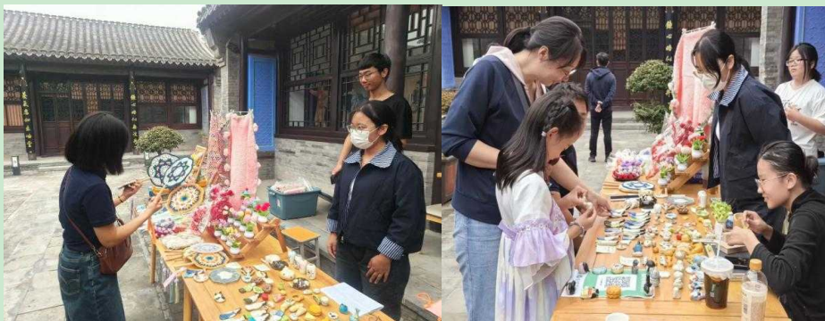
图 1-2 淮军公所非遗手工市集

以匠心致初心，以文脉续华章。保定理工学院产品设计专业开展的实践活动不仅充分展现了专业在育人成果与社会服务方面的卓越能力，更以设计为笔，描绘了一幅融古汇今、匠心独运的精彩画卷。