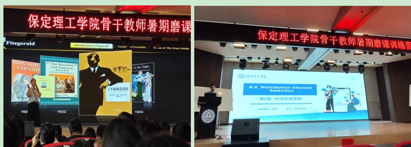
图 磨课训练营现场

两位教师在“骨干教师暑期磨课训练营”中，不仅深化了对课程改革的理解，还通过反复磨课掌握了多种教学技巧与策略，学会了如何设计更具吸引力的课堂互动，有效激发学生学习兴趣；同时，也提升了对教学内容的精准把握与深度解读能力。此外，通过观摩与互评，两人相互借鉴，共同进步，积累了丰富的教学案例与经验。这次训练营不仅让他们的教学能力实现质的飞跃，更促进了教育理念的更新与升华。