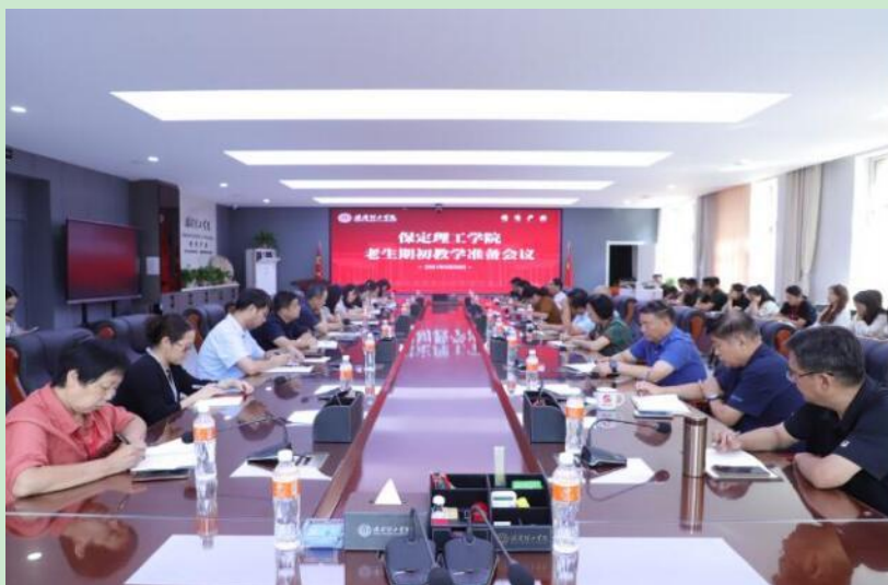
图 保定理工学院期初教学准备会议

针对以上存在的问题，请相关部门予以重视，对出现的问题责任到人、明确标准、限期整改，在新学期伊始为师生营造良好的教育教学环境。