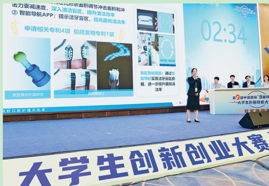
第九届中国国际“互联网+”大学生创新创业大赛

兴伟业，对时代新人的基本素质和精神状态等提出了全新要求，迫切需要以更为宏阔的视野和更为主动的担当，谋深谋实如何进一步加强和改进学校教育工作，进一步健全德智体美劳全面培养体系，进一步提升教师教书育人能力，更好地把青少年学生凝聚和团结在党的旗帜下，以更强的能力本领积极投身并担当好中国式现代化建设事业。