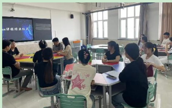
图 Steam 课程培训班结业仪式

指导老师代表回顾了学员们在 Steam 课堂上学习生活的点点滴滴，对大家所展现出的勤奋好学、勇于探索的精神给予了高度评价。他鼓励学员们将所学知识和技能应用于未来的教育工作中，为学生们提供更加优质、高效的教育服务。