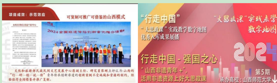
图 线上观看视频截图

非遗文化传承是保护人类文明、传承民族文化的重要手段，体现人类文明发达程度，维护民族文化统一性，传承民族文化精髓，提升学生文化艺术修养，推动非遗文化产业发展，对实现民族复兴有重要作用。